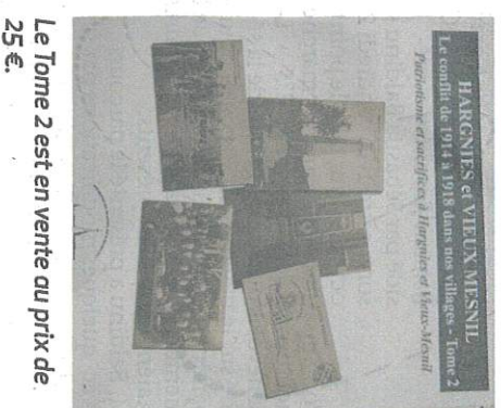
Le Tome 2 est en vente au prix de 25 €.

Outre le focus sur les Britanniques venus libérer le territoire, une large part du livre est consacrée aux Poilus de Vieux-Mesnil et d'Har-